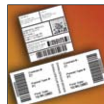
Etiquetas para envios e logística