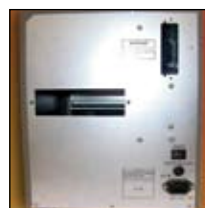
Porta de interface para várias opções de conectividade