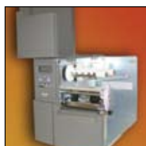
Facilidade para carregar suportes dobrados em harmónio