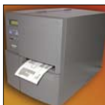
Chassis metálico robusto e durável